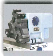
Torretta verticale 6 posizioni Vertical tool post at 6 positions