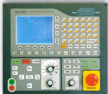
CNC VISEL VSC 990-T

• Diametro mandrino autocentrante: Self-centering spindle swing 200 mm (Q 500) - 250 mm (Q 1000-1500)