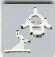
Lunetta fissa e lunetta mobile Steady rest and follow rest