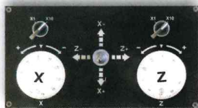
Volantini elettronici sensibili Electronic Handwheel and joystick